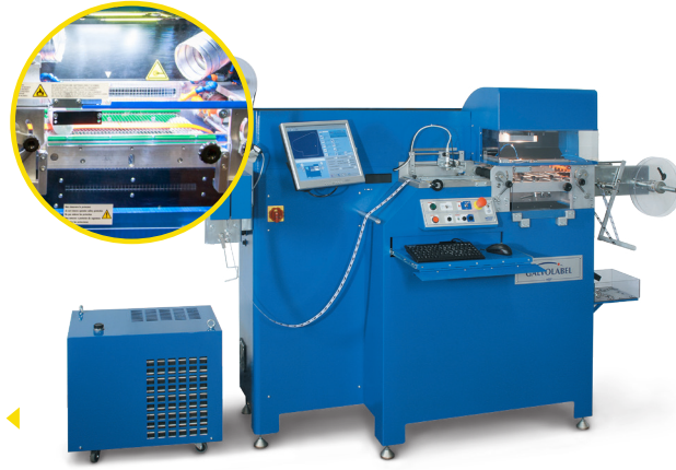
ماكينة GALVOLABEL متكاملة مع L1 (خيار)