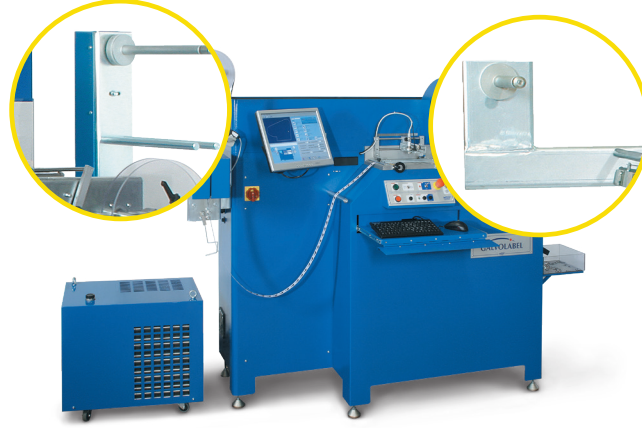
ماكينة GALVOLABEL متكاملة مع AL (خيار)